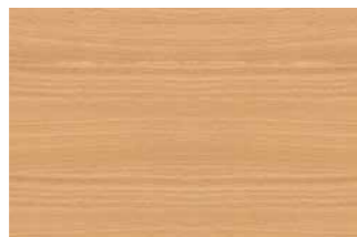
Buche Natur (Standard).