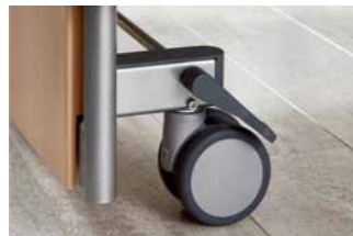
Paarweise Rollenfeststellung in jeder Liegeflächenposition.