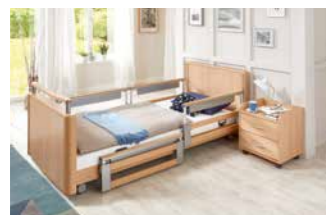
Teleskopierbare Seitensicherung (TSG).