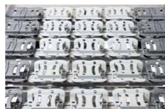
Die Komfort-Liegefläche besteht aus 50 freischwingenden Feder-elementen.