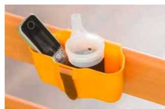
Die Aufnahmeschale für Brillen, Handys oder Pflegeutensilien lässt sich an der durchgehenden Seitensicherung anbringen.