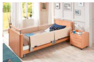
Schaumlederbezug für TSG.