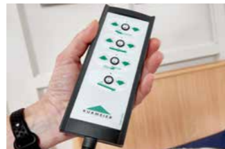
Handschalter mit selektiver Sperrung.