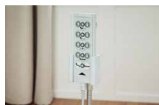
Flexibler Geberhalter für den Handschalter.