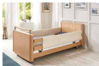
Schaumlederbezug für DSG.