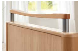
Griffleiste aus Massivholz.