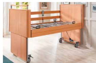
Liegehöhenverstellung von 22-77 cm, Verstellbereich = 55 cm